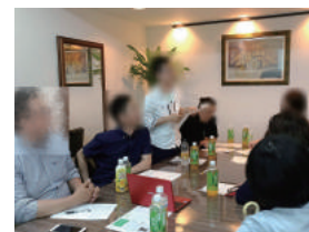
セミナー会場でのワークショップ、楽しく熱い議論！