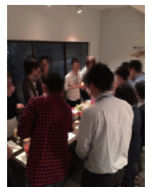
ワインバーで交流会！