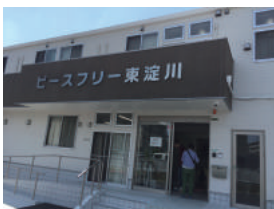
ピースフリー東淀川に到着！ とてもきれいな施設でした。