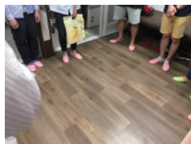
なぜかお風呂場で自己紹介。 皆さんの熱気が伝わりました。